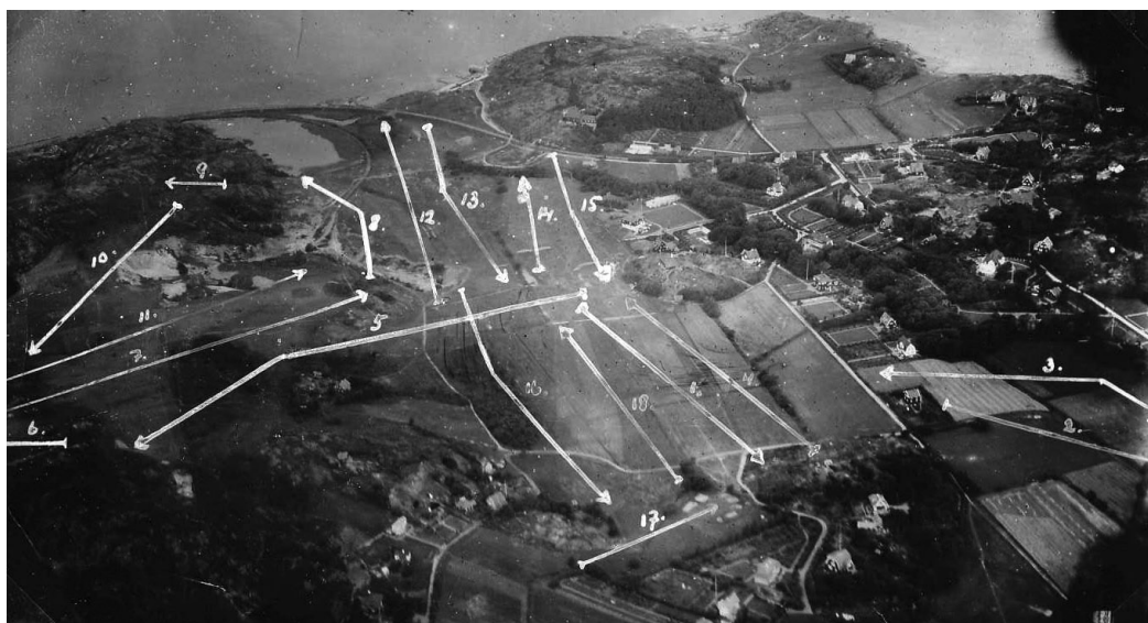
Några andra kortvariga försök med annan numrering av hålen gjorde man också.