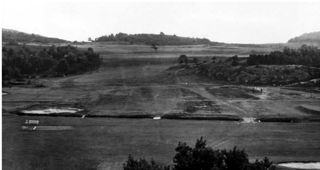
Nuvarande 3e hålet år 1933.